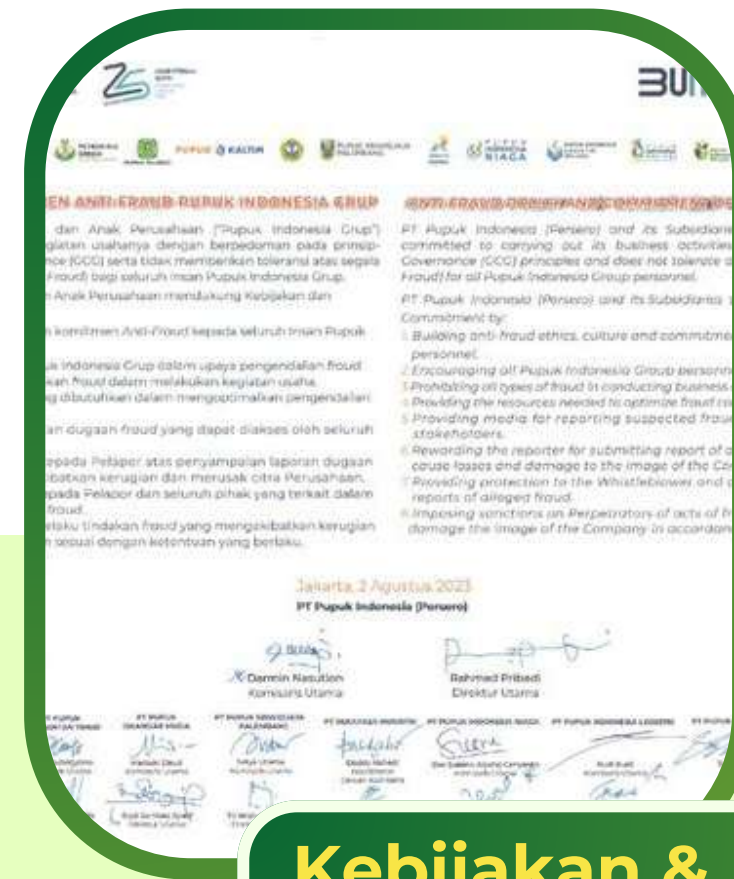
Kebijakan & Komitmen Anti-Fraud PI Group

PEKAPG adalah sistem aplikasi penandatanganan Pernyataan Kepatuhan (Pakta Integritas) atas PEBK (Pedoman Etika Bisnis dan Etika Kerja, Kode Etik & Panduan KPU (Kepatuhan Persaingan Usaha) serta Kebijakan dan Komitmen Anti-Fraud PI Group bagi Insan Petrokimia Gresik yang dilakukan secara online.